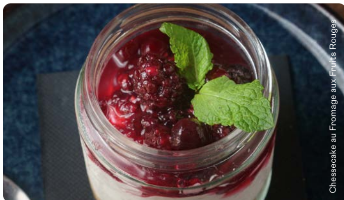
Cheesecake au Fromage aux Fruits Rouges