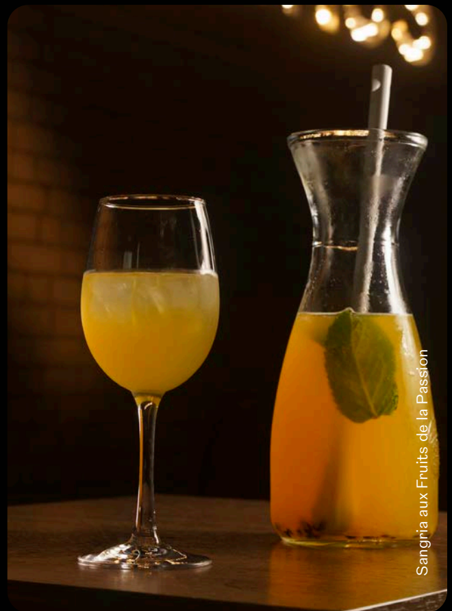
Sangria aux Fruits de la Passion