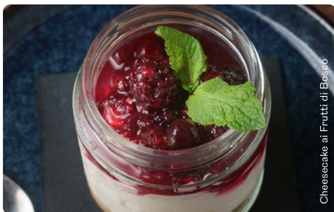
Cheesecake ai Frutti di Bosco

Mix di lattughe (Lattuga iceberg, Rucola, Crescione), pomodoro, cetriolini di cipolla, formaggio di capra caramellato, erbe aromatiche (Cipollina, Coriandolo), semi di zucca tostati, fragole croccanti, vinaigrette di fragole.