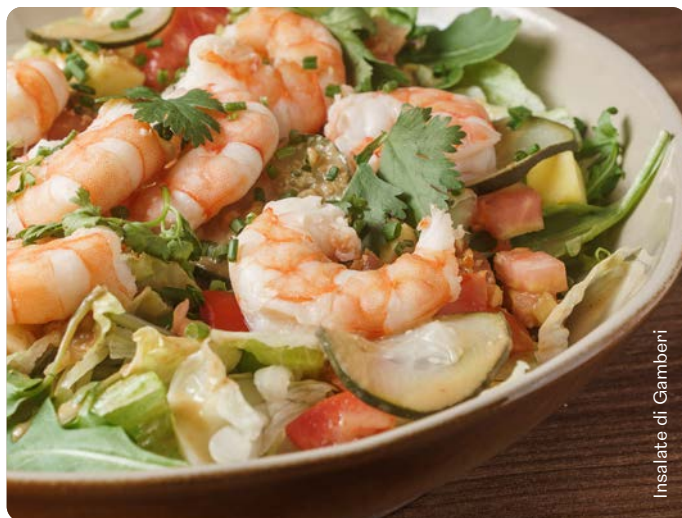
Insalata di Gamberi

Solo disponibile per bambini fino a 12 anni.