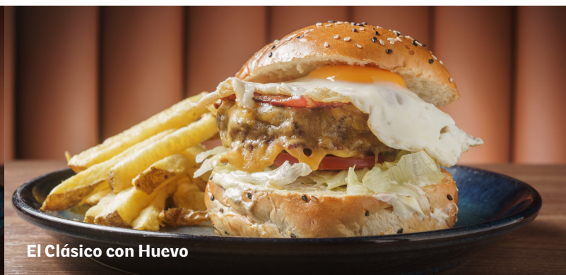
El Clásico con Huevo