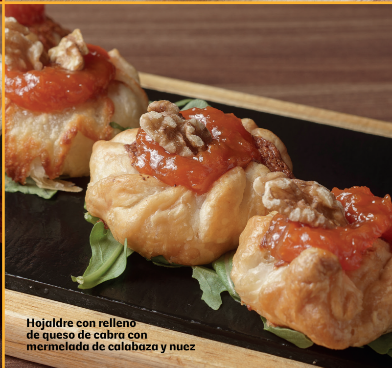
Hojaldre con relleno de queso de cabra con mermelada de calabaza y nuez