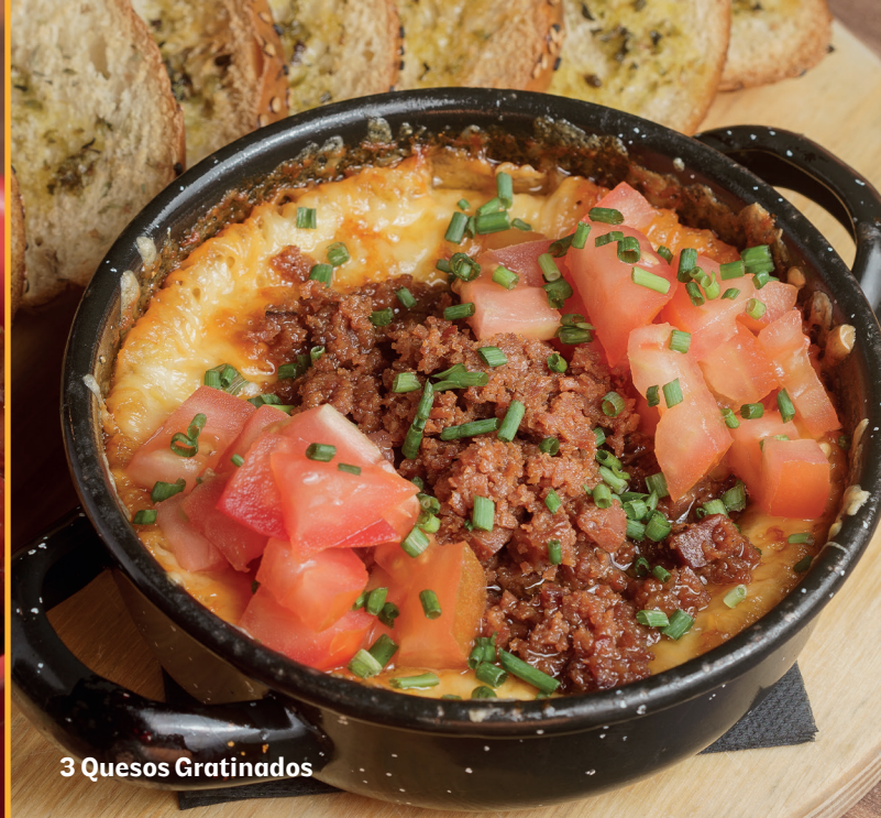
3 Quesos Gratinados