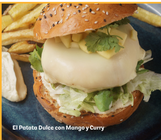
El Patata Dulce con Mango y Curry

Pan de sésamo, hamburguesa de patata dulce, queso feta, calabacín a la parrilla, pasta de aceitunas, lechuga, rucula, tomate y pickle de cebolla.