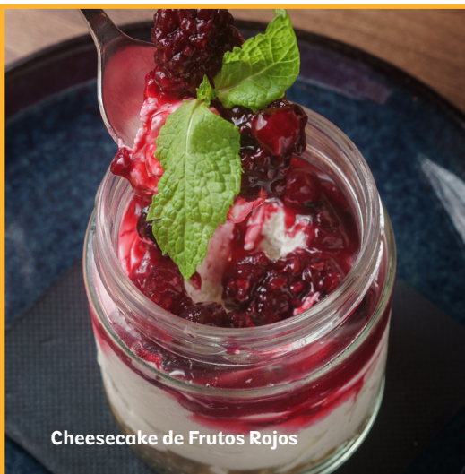
Cheesecake de Frutos Rojos