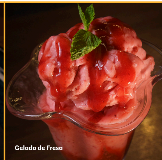
Gelado de Fresa