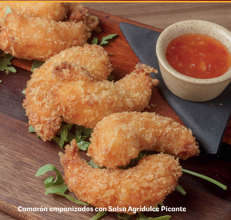
Camarón empanizados con Salsa Agridulce Picante