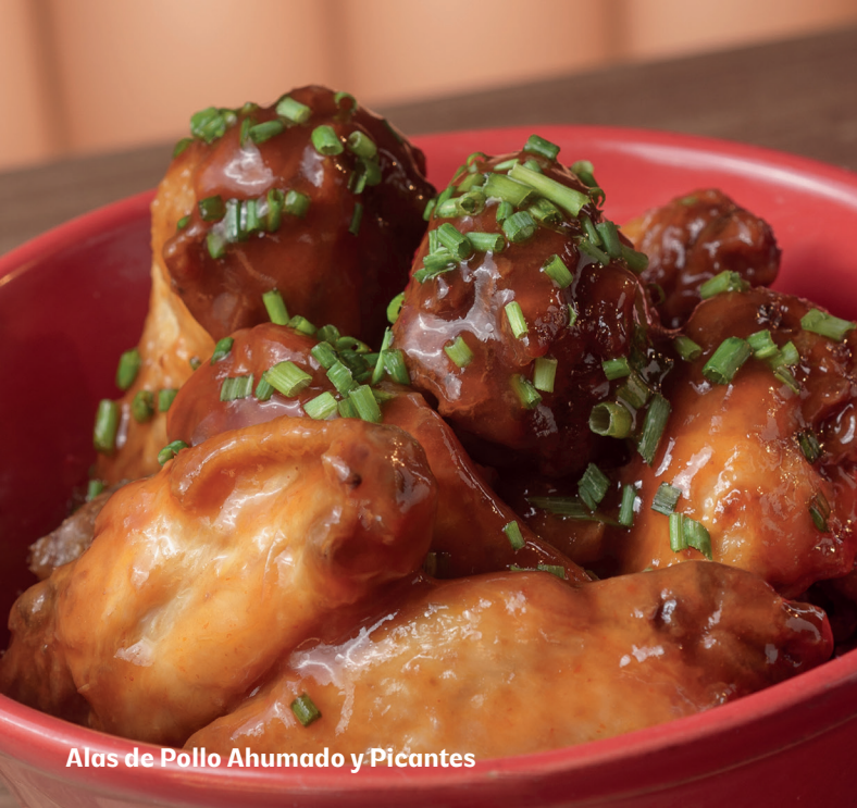
Alas de Pollo Ahumado y Picantes