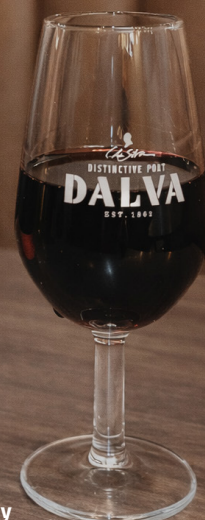
Vino do Porto Dalva Tawny