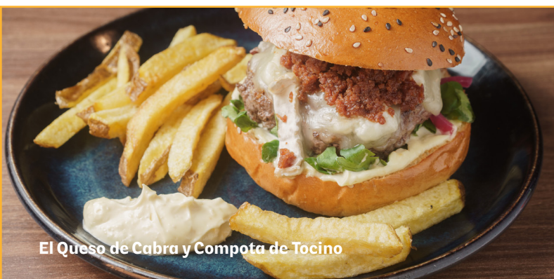
El Queso de Cabra y Compota de Tocino

Pan de sésamo, hamburguesa, queso de cabra, compota de tocino, pickle de cebolla, berro y aioli.