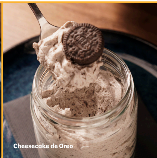
Cheesecake de Oreo