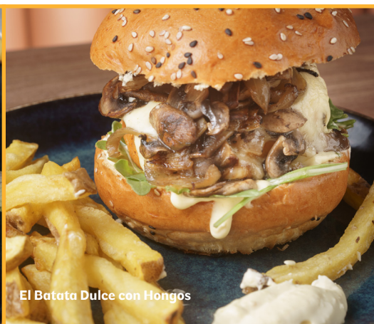
El Batata Dulce con Hongos