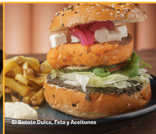
El Batata Dulce, Feta y Aceitunas