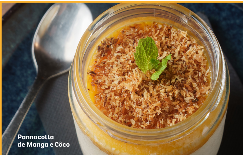
Pannacotta de Manga e Côco