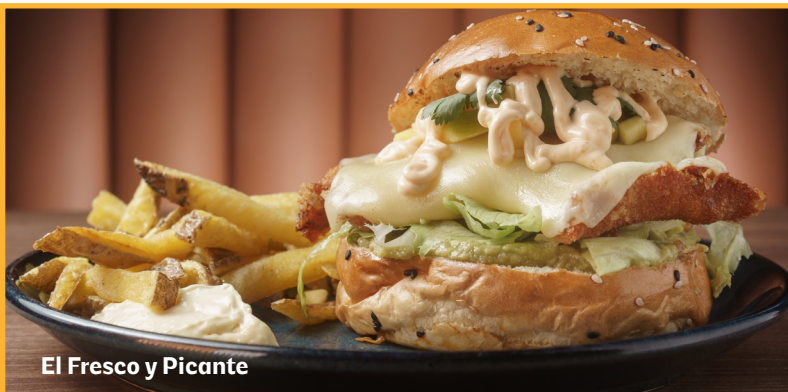
El Fresco y Picante

Pan de sésamo, pechuga de pollo marinado en soja y jengibre y panado, tocino, queso cheddar, lechuga, tomate, salsa de BBQ.