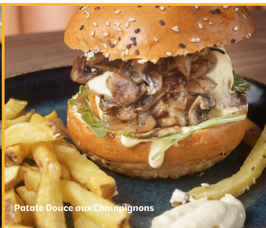
Patate Douce aux Champignons