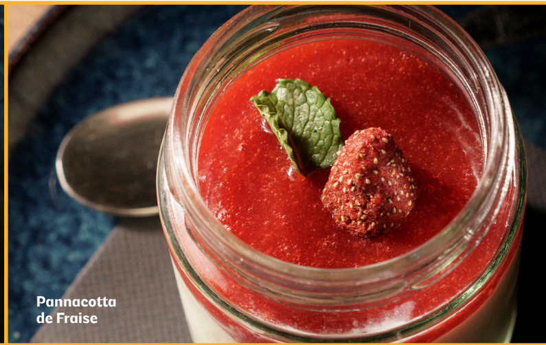
Pannacotta de Fraise