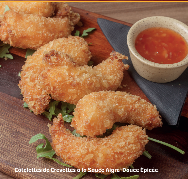
Côtelettes de Crevettes à la Sauce Aigre-Douce Épicée