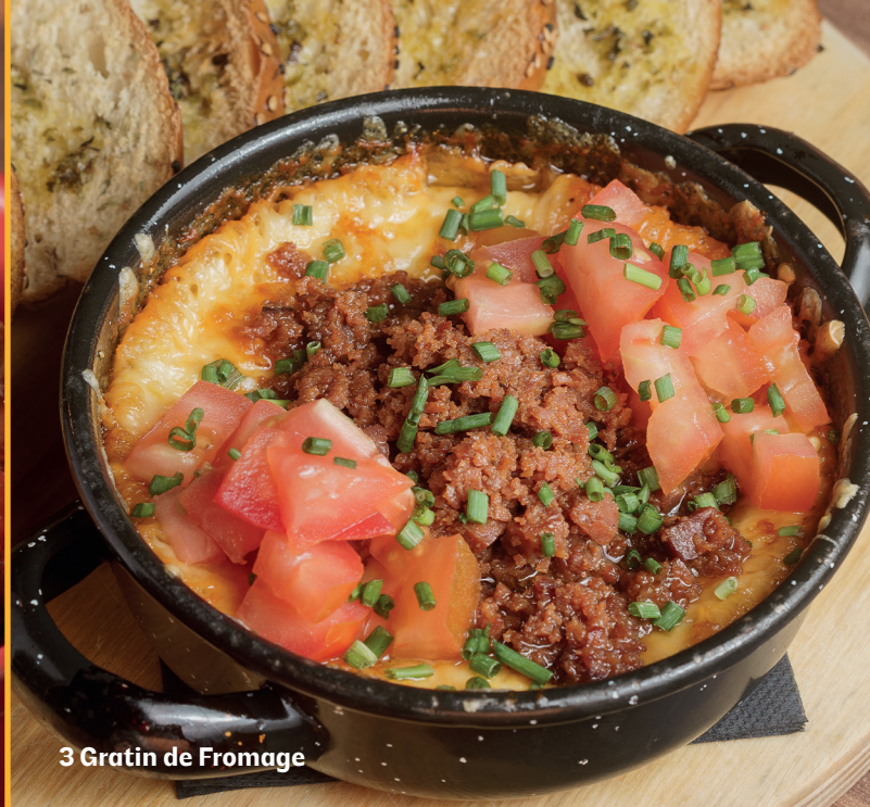
3 Gratin de Fromage