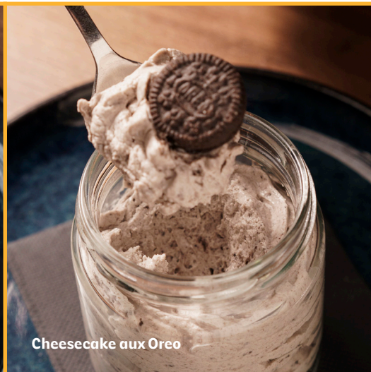
Cheesecake aux Oreo