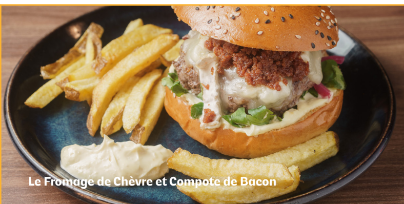
Le Fromage de Chèvre et Compote de Bacon

Pain au sésame, hamburger, fromage de chèvre, compote de bacon, cornichon à l'oignon, cresson et aioli.