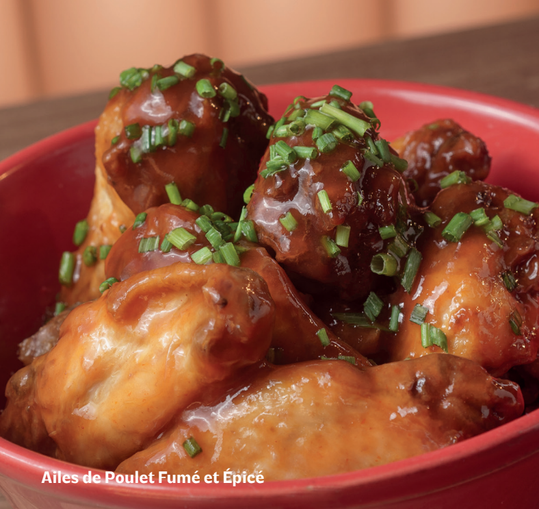
Ailes de Poulet Fumé et Épicé