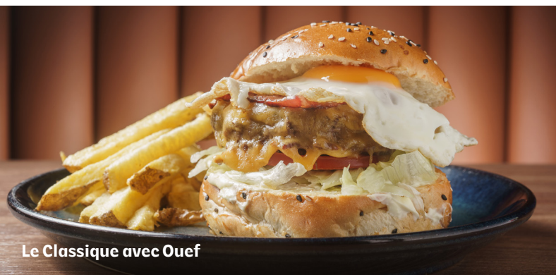
Le Classique avec Oeuf