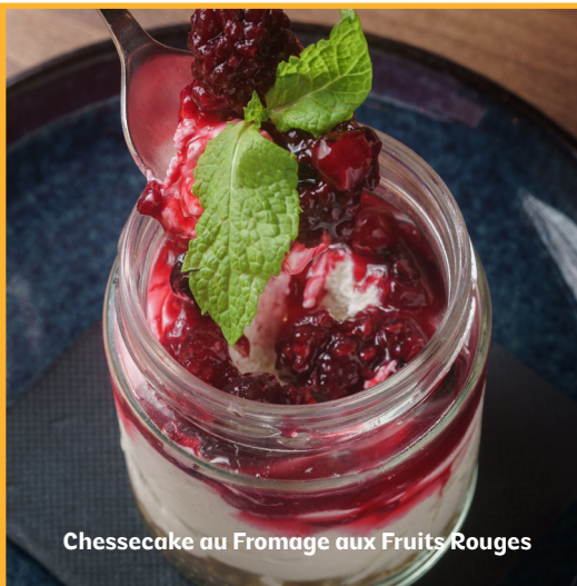
Chessecake au Fromage aux Fruits Rouges