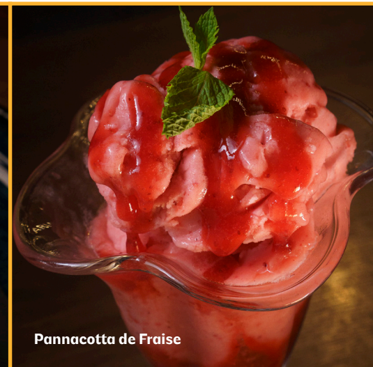
Pannacotta de Fraise