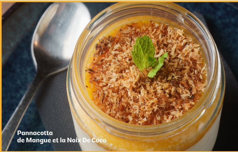
Pannacotta de Mangue et la Noix De Coco