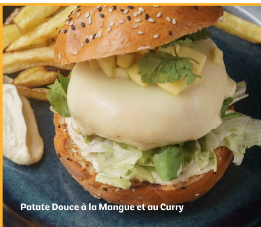
Patate Douce à la Mangue et au Curry

Pain au sésame, Hamburger de patates douces, Fromage feta, Courgette grillée, Pâte d'olives, Laitue, Roquette, Tomates, Cornichon à l'oignon.