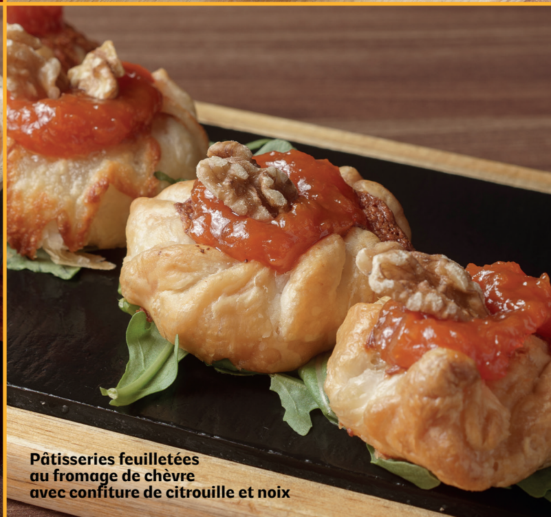
Pâtisseries feuilletées au fromage de chèvre avec confiture de citrouille et noix