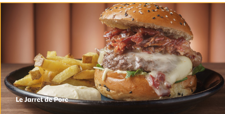
Le Jarret de Porc