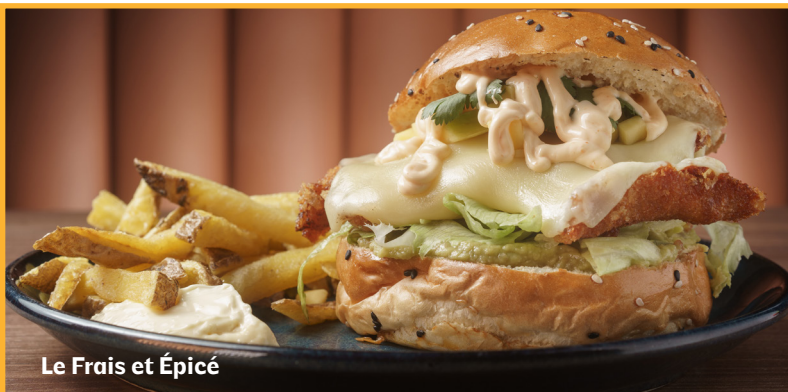
Le Frais et Épicé

Pain au sésame, poitrine de poulet marinée au soja et au gingembre et pané, bacon, fromage cheddar, bacon, laitue, tomate et sauce barbecue.