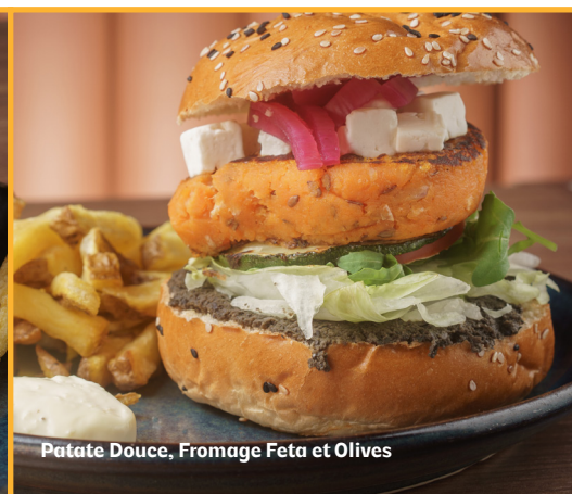
Patate Douce, Fromage Feta et Olives