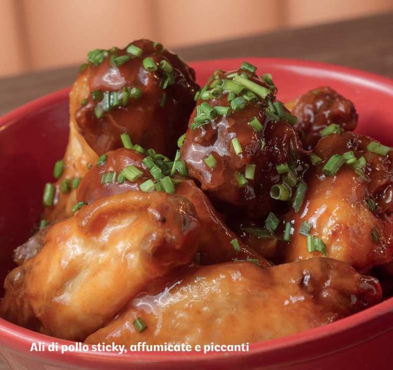
Ali di pollo sticky, affumicate e piccanti