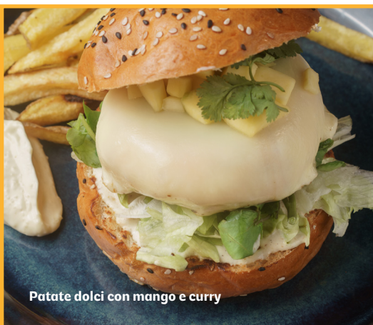
Patate dolci con mango e curry

Panino al sesamo, hamburger di patate dolci, formaggio feta, zucchine grigliate, pasta di olive, lattuga, rucola, pomodoro e cipolla sottaceto.