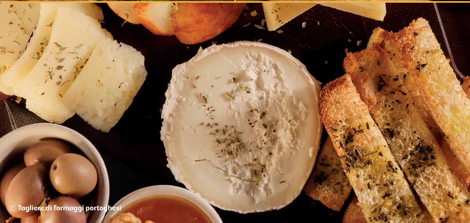
Tagliere di formaggi portoghesi