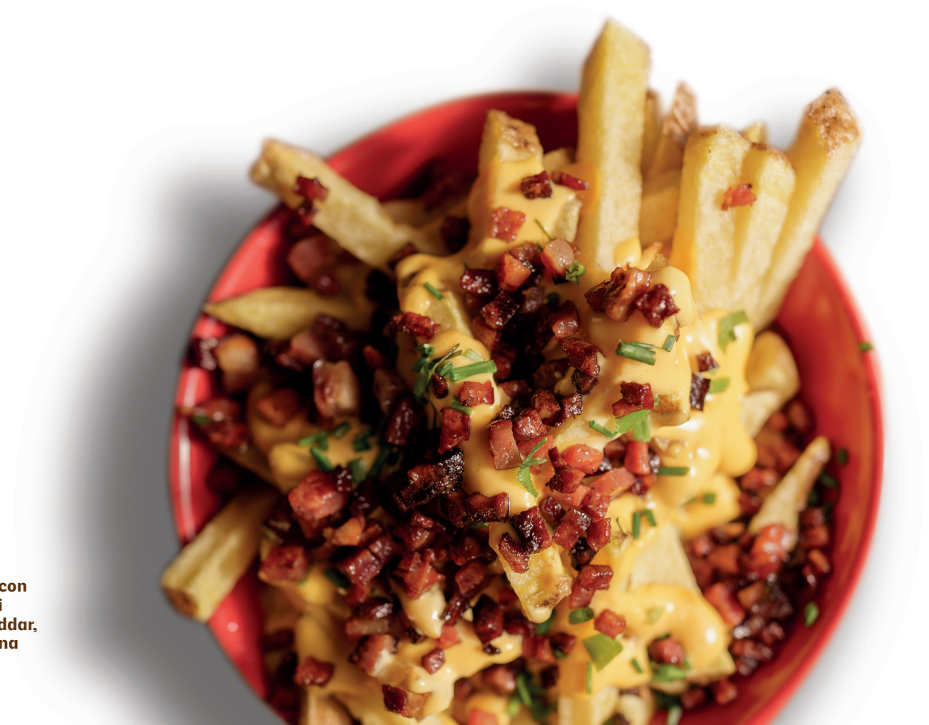
Patatine fritte con buccia, salsa di formaggio Cheddar, Bacon e Cipollina