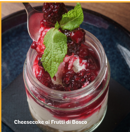
Cheesecake ai Frutti di Bosco