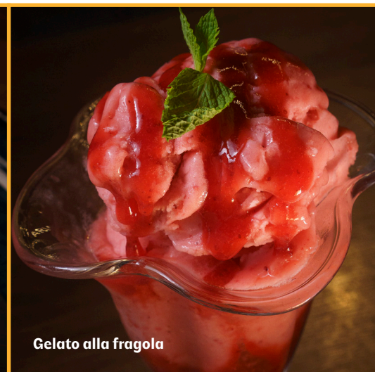
Gelato alla fragola