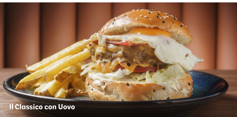
Il Classico con Uovo