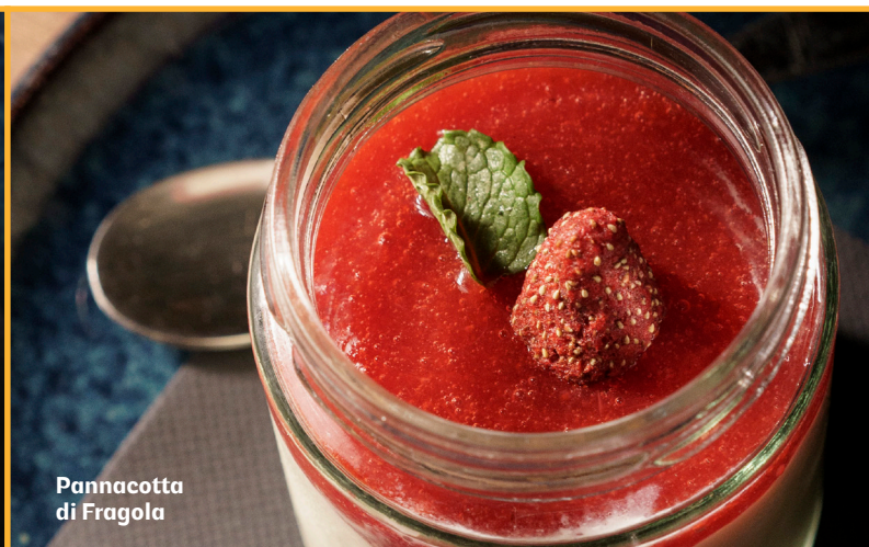
Pannacotta di Fragola