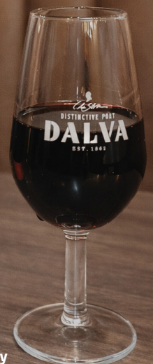
Vino do Porto Dalva Tawny