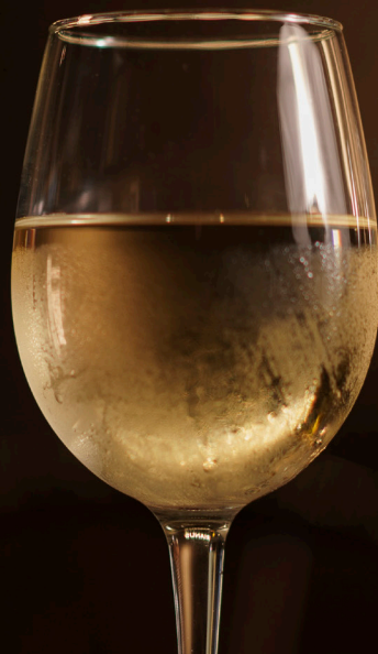
Vino Verde Bico Amarelo (Esporão)