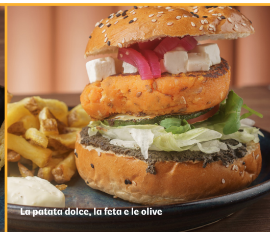
La patata dolce, la feta e le olive