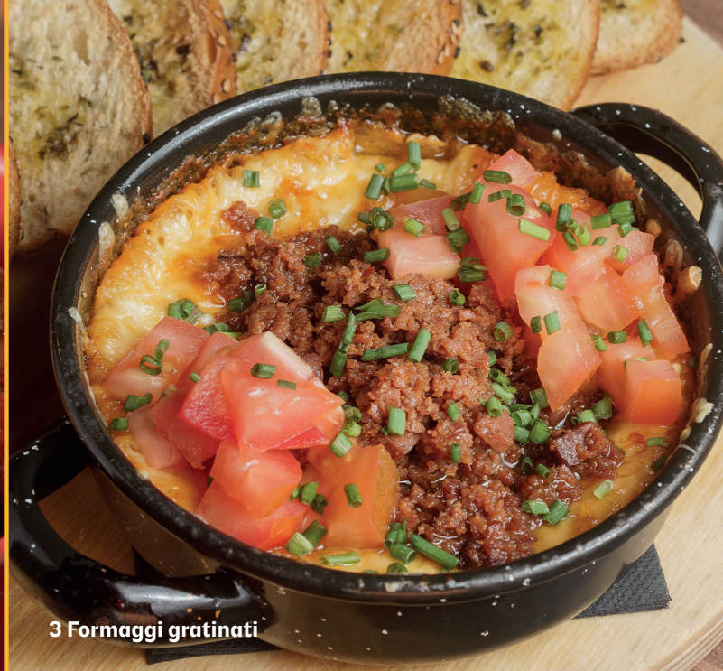
3 Formaggi gratinati