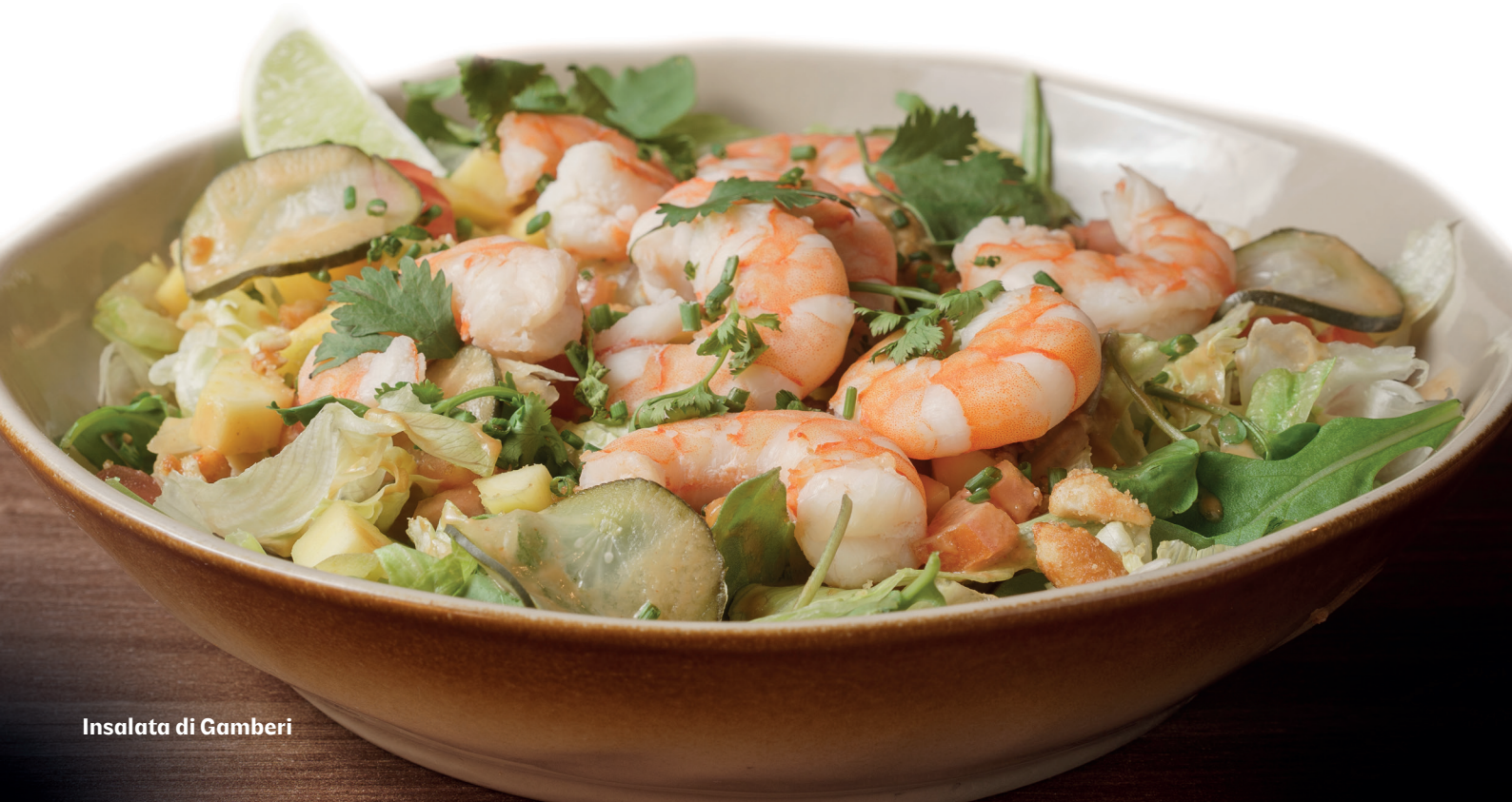
Insalata di Gamberi

Mix di lattughe (Lattuga iceberg, Rucola, Crescione), pomodoro, cetriolini di cipolla, formaggio di capra caramellato, erbe aromatiche (Cipollina, Coriandolo), semi di zucca tostati, fragole croccanti, vinaigrette di fragole.