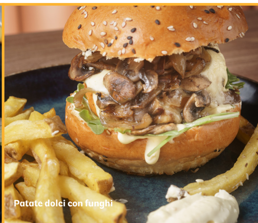
Patate dolci con funghi