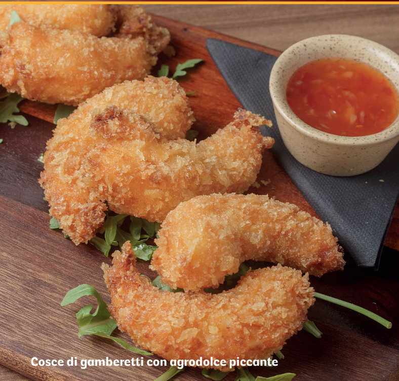
Cosce di gamberetti con agrodolce piccante