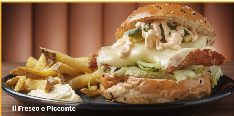
Il Fresco e Piccante

Panino al sesamo, petto di pollo impanato marinato in salsa di soia e zenzero, bacon, formaggio Cheddar, lattuga, pomodoro e salsa barbecue.