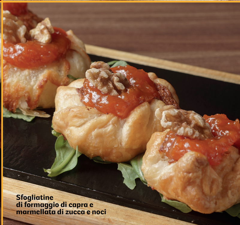
Sfogliatine di formaggio di capra e marmellata di zucca e noci