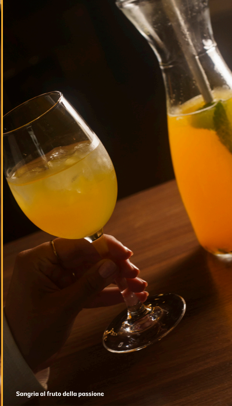
Sangria al frutto della passione