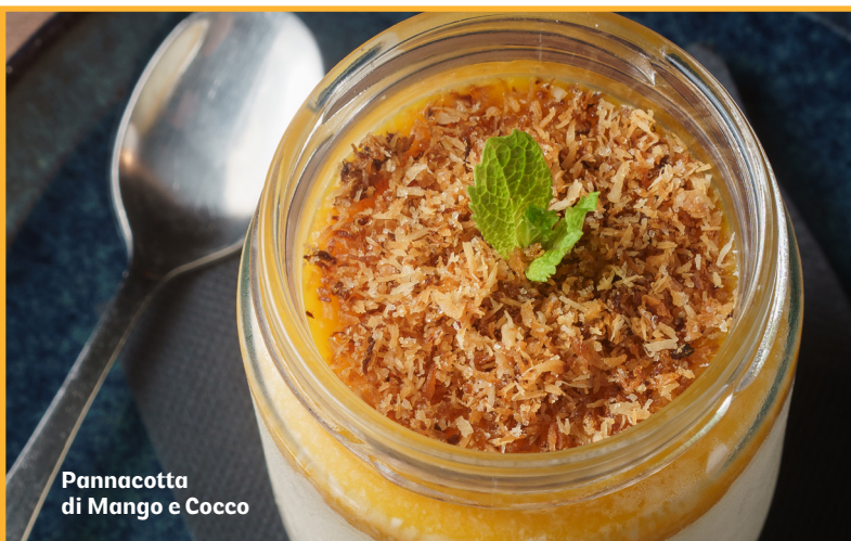
Pannacotta di Mango e Cocco