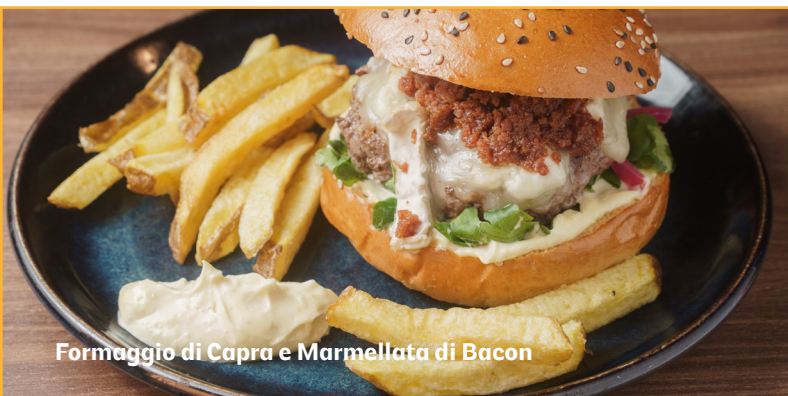
Formaggio di Capra e Marmellata di Bacon

Panino al sesamo, hamburger, formaggio di capra, marmellata di bacon, cetriolino di cipolla, crescione e aioli (maionese d'aglio).